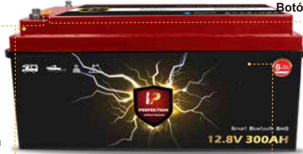
• Apertura de Tornillo