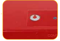
• Botón de Reinicio