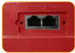
• Interfaz de Comunicación de Terminal