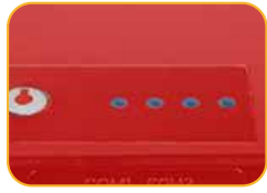
• 4 Indicador de Encendido